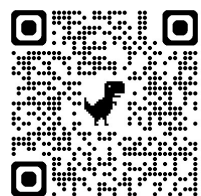
↑選定ナビのQRコードです！↑