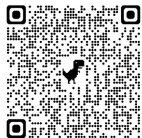
↑選定表のQRコードです！↑

② 標準化による設計、調達の手間削減！ （実働10日後メーカー出荷） 選定ナビで簡単選定！